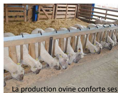
La production ovine conforte ses résultats en 2016

L'équipe des réseaux d'élevage ovins du GrandEst, Chambres d'agriculture et Institut de l'élevage